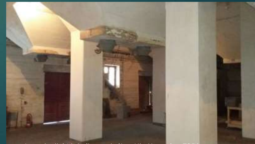
Jens koll (Abteilungsleiter Klettern im TSB)